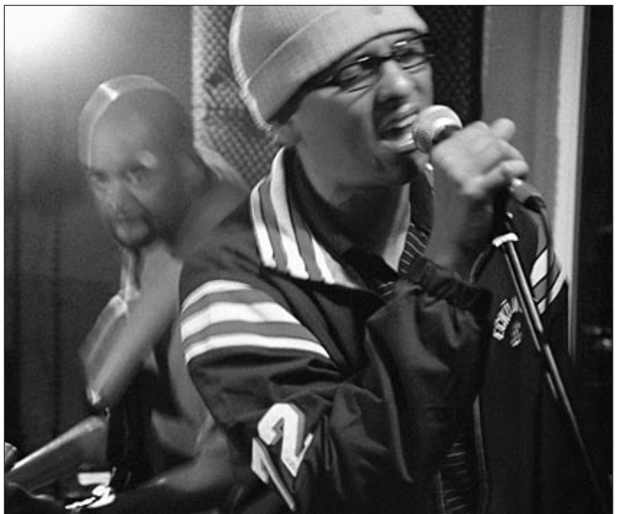
Xavier Naidoo live